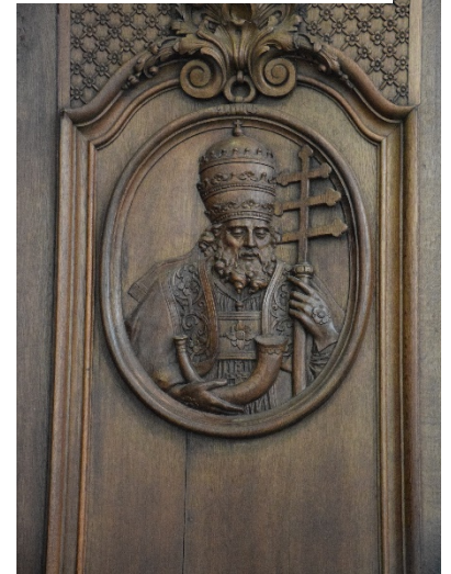
2.1.2 Geschiedenis en cultuurhistorische