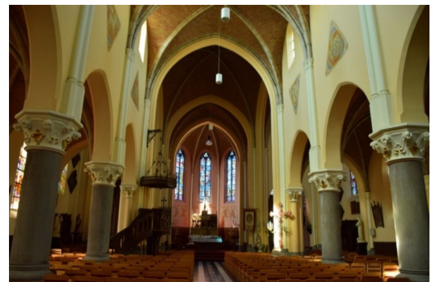
2.3.1 : De parochiekerk Sint Petrus in Olsene als gebouw